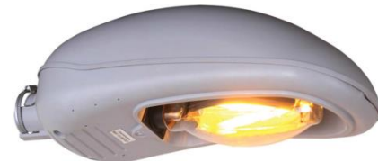
Лучшие практики WG