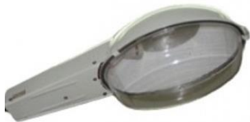
РКУ / ЖКУ 250 Вт